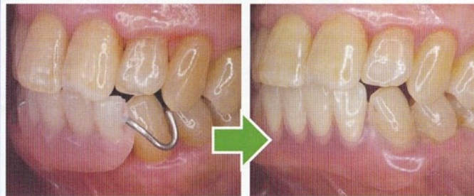
スマイルデンチャー